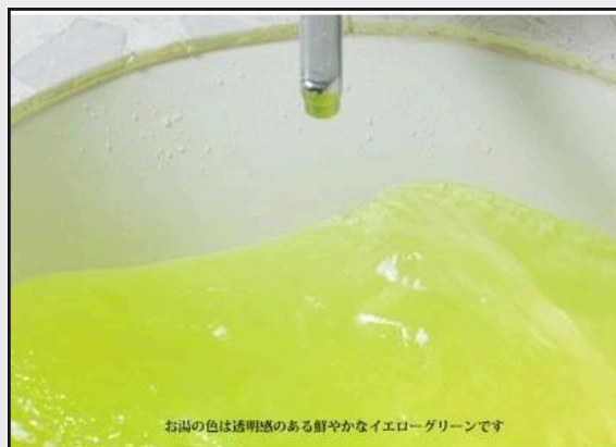
お湯の色は透明感のある鮮やかなイエローグリーンです

別府の湯には肩こり、腰痛、冷えなど17つの効能が期待できます。ミネラルが豊富で肌もツルツルになり、湯冷めもしにくくなります。また弱アルカリ性で硫黄成分を含まないため浴槽や給湯器を傷めずご家庭でも安心してご利用いただけます。